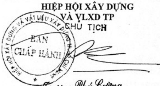
Trương Phú Cường BÁT ĐỘNG SẢN TP CHỦ TỊCH